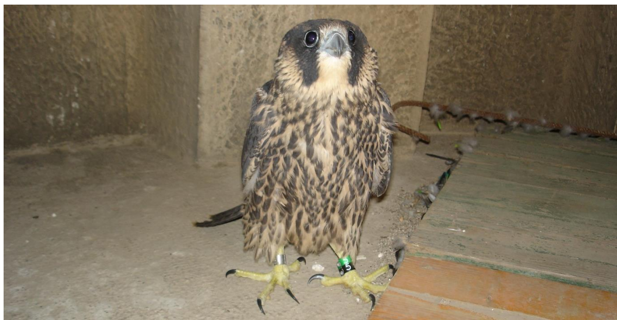
Falcó jove caigut i tornat al niu de la Sagrada Família

Quan un particular troba un falcó i truca a qualsevol telèfon d'urgències de l'administració (112), se sol derivar al telèfon del Control Central del CAR, en servei 24 hores, des d'on se li comunica que, si el té capturat, el porti a la clínica veterinària més propera o bé que el CAR li passarà a buscar. També pot passar que siguin els propis Agents Rurals que facin el rescat a resultes de la trucada d'un ciutadà o de la petició de col·laboració de les policies locals. Sigui com sigui, un cop els Agents Rurals tinguin l'ocell en el seu poder el procediment a seguir en cas de tractar-se d'un poll envolat (marronós amb barrat vertical al pit, amb restes de plomissol) és el següent: